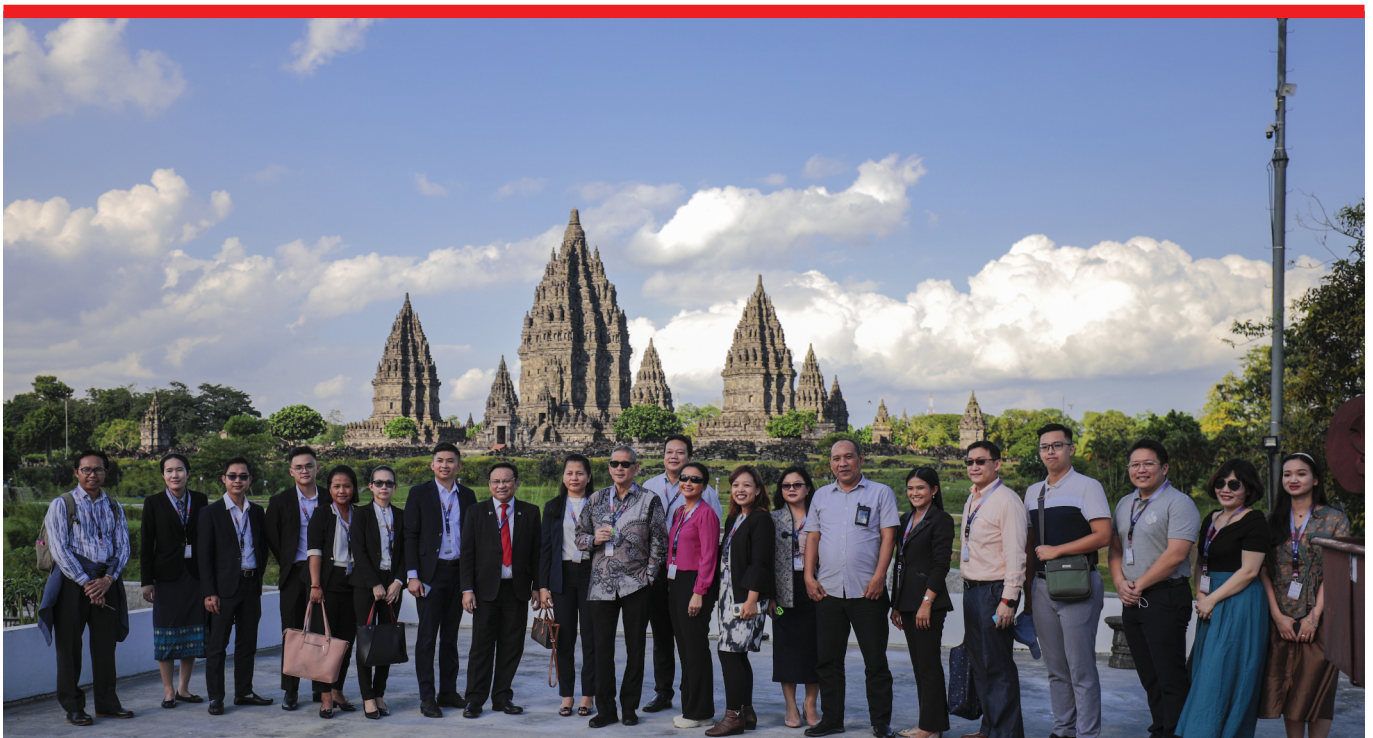
Dokumentasi ACPACC dan AMCI site-visit PT Taman Wisata Candi Borobudur, Prambanan, dan Ratu Boko