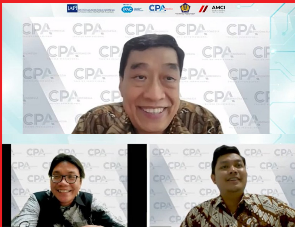
Dokumentasi Webinar Embracing the Technological Frontier: Accountants in the New Age of Technology.

Walaupun kedepannya menggunakan teknologi Artificial Intelligence (AI), ada beberapa hal yang memerlukan pertimbangan profesional seperti pengetahuan, pengalaman dan kemampuan para akuntan. Diharapkan para akuntan dapat menangkap ancaman sebagai tantangan untuk terus beradaptasi dan berprestasi di era digitalisasi.