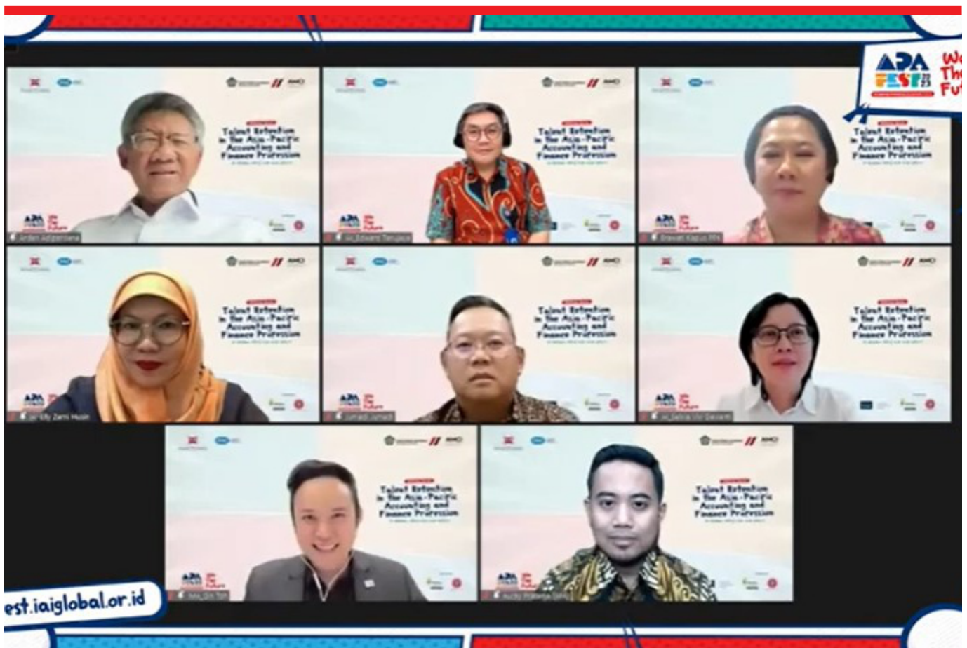
Dokumentasi Webinar ASEAN CPA: Talent Retention in the Asia-Pacific Accounting and Finance Profession.